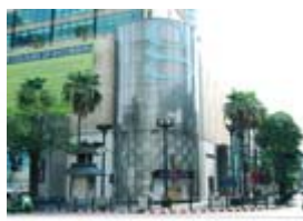
GAY SORN PLAZA